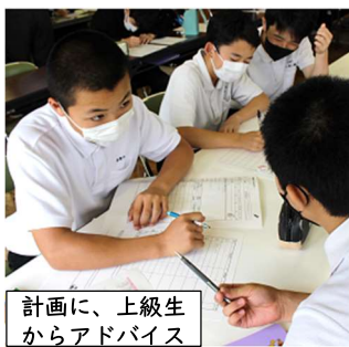
計画に、上級生からアドバイス