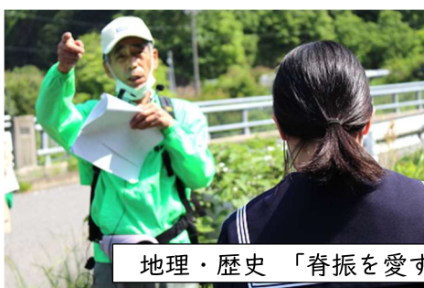
地理・歴史 「脊振を愛する会」○○様、○○様